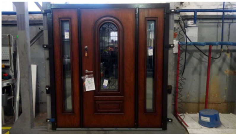
Фото без надставки.